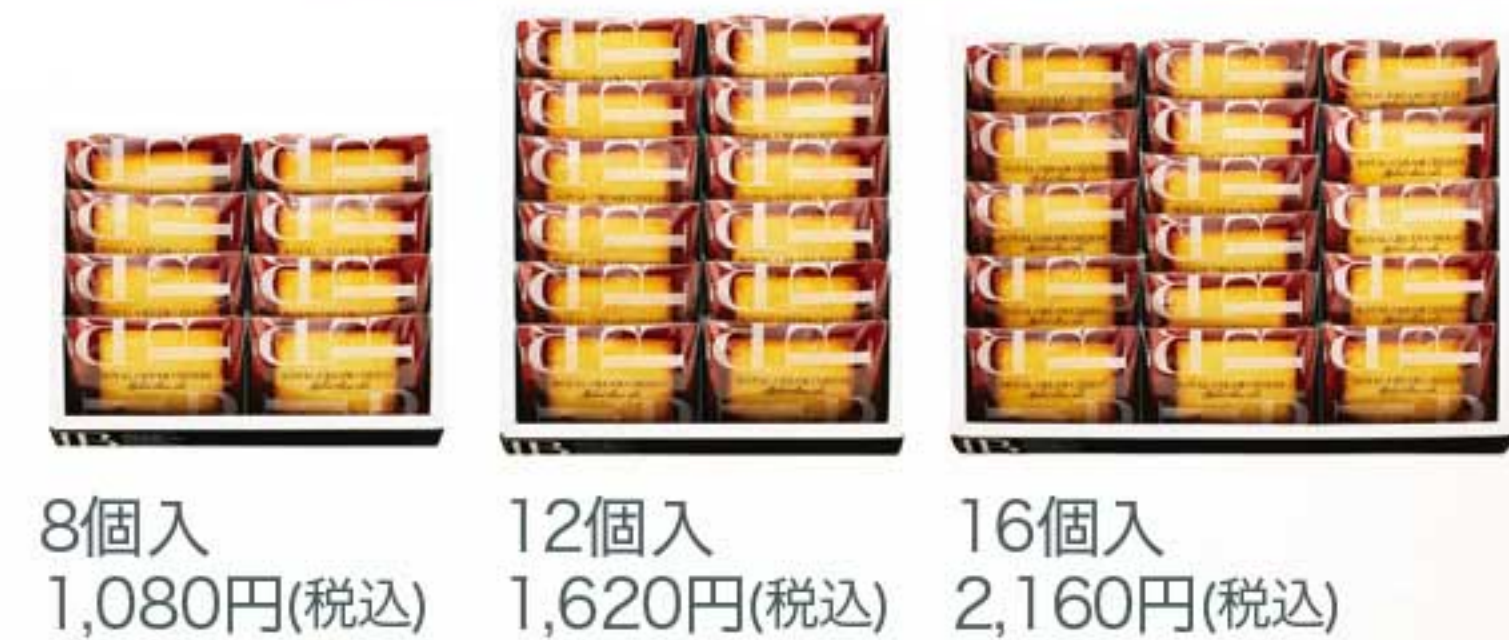
8個入 1,080円(税込) 12個入 1,620円(税込) 16個入 2,160円(税込)

販売期間: 2017年9月1日～(販売中) / 販売店舗: 全国のモロゾフ店舗 ※一部取扱いが無い場合がございます。