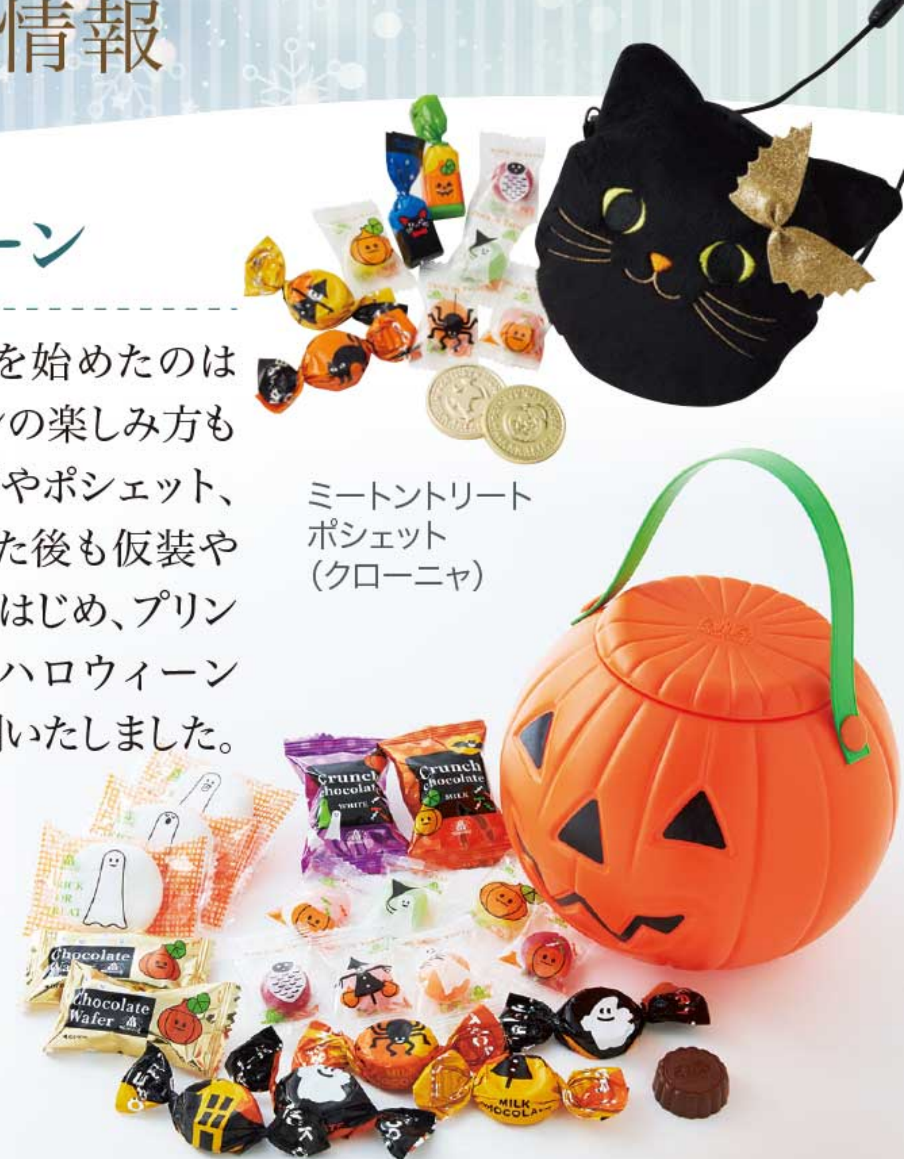
ミートンリートポシェット(クローニャ)