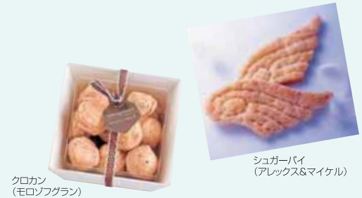
クロカン (モロゾフラン)