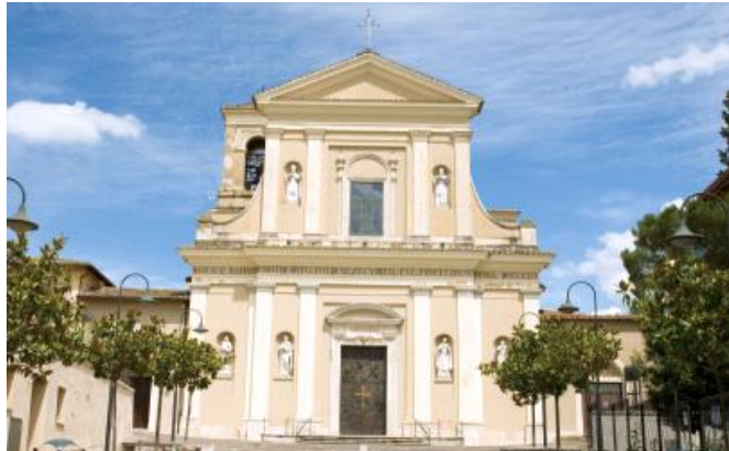
(上)テルニ市 聖バレンチノ教会

人々が大切に伝えてきた「聖バレンチノ司教の物語」こそが、バレンタインデーの原点。バレンタインのルーツテルニ市と日本のバレンタイン発祥の街神戸市。モロゾフはふたつの街の交流にも力を注いでいます。