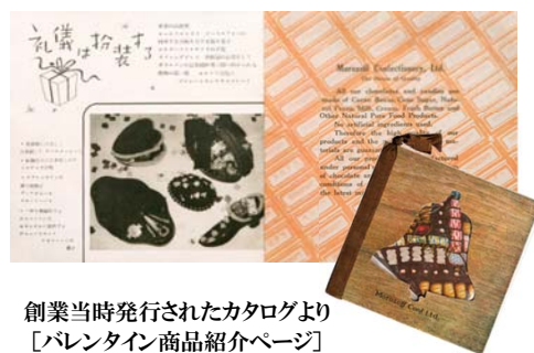
創業当時発行されたカタログより [バレンタイン商品紹介ページ]

モロゾフが生まれたのは1931年(昭和6年)8月。西洋文化の洗礼を受けた港町神戸で、お洒落でハイカラなチョコレートの製造販売をはじめました。翌1932年、モロゾフは日本で初めて「バレンタインデーにチョコレートを贈る」というスタイルを紹介。「欧米では2月14日に愛する人に贈りものをする」という習慣を米国人の友人から聞き知った創業者が、この素晴らしい贈りもの文化を日本でも広めたいと考えたことがきっかけでした。当時のカタログには、ハート型のチョコレート容器にファンシーチョコレートを入れた「スイートハート」、バスケットに花束のようなチョコレートを詰めた「ブーケダムール」が掲載されています。