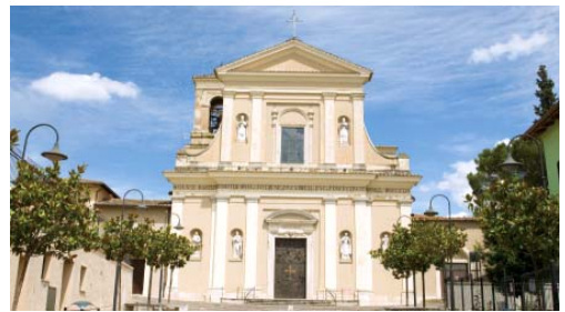
(上)テルニ市 聖バレンチノ教会

バレンタインのルーツ テルニ市と日本のバレンタイン発祥の街神戸市。モロゾフはふたつの街の交流にも力を注いでいます。