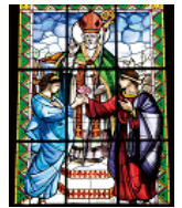
(右)教会のステンドグラスに描かれた伝説の一部