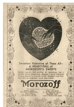
このたび新たに発見された、 1935年のバレンタインチョコレート広告