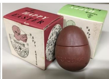
イースター商品 (左)1964年 (右)1966年