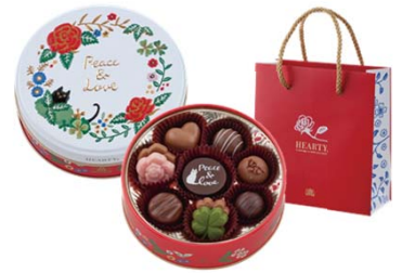
ハーティー 810円(税込) 10個入