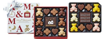
ボンニユイ 864円(税込) 22個入