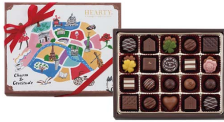
ハーティー 1,620円(税込) 23個入

恋人、友達、家族、仲間...。 HEARTY(ハーティー)は、みんなのハートに 幸せなメッセージを届けるブランドです。 2018年は、パリの街並みを描いたおしゃれな パッケージ。あちこちに登場する猫の目線で 風景を表現しています。