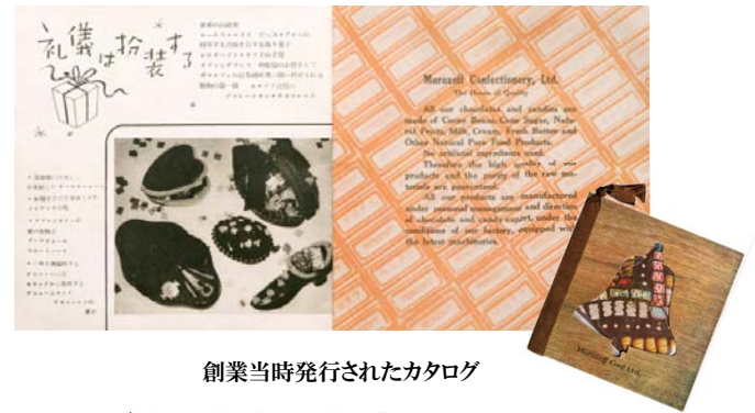
創業当時発行されたカタログ

モロゾフが生まれたのは1931年(昭和6年)8月。西洋文化の洗礼を受けた港町神戸で、お洒落でハイカラなチョコレートの製造販売をはじめました。翌1932年には、日本で初めてバレンタインチョコレートを発売。当時のカタログには、ハート型のチョコレート容器にファンシーチョコレートを入れた「スイートハート」、バスケットに花束のようなチョコレートを詰めた「ブーケダムール」が紹介されています。モードな香りに満ちた写真とコピーは、人々を夢中にさせたとか。