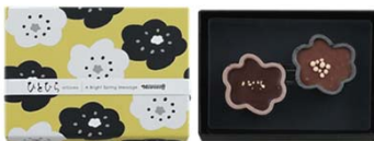
ひとひら(墨色) 540円(税込) 2個入

最中を組み合わせた和菓子風のチョコレートの詰合せ。 柚子、ストロベリー、ミルク、3種類の味が楽しめます。