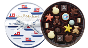
カタリナアイランド 1,080円(税込) 22個入