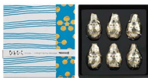
ひとひら(清流に梅) 648円(税込) 6個入