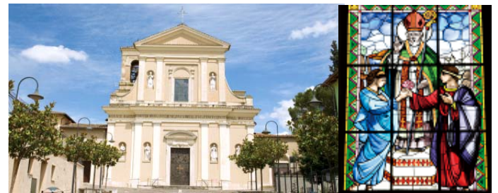
(左)テルニ市聖バレンチノ教会 (右)教会のステンドグラスに描かれた物語

バレンタインデーのルーツを探していた私たちは1984年、イタリアのウンブリア州テルニ市にある「聖バレンチノ教会」と運命の出会いを果たしました。人々が大切に伝えてきた「聖バレンチノ司教の物語」こそが、バレンタインデーの原点。この地ではじまった習慣が、海を越えて日本に届いたのです。