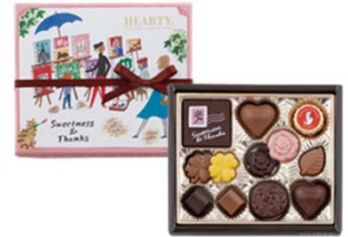
ハーティー(ピンク) 540円(税込) 12個入