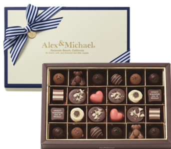
アレックス&マイケル 2,484円(税込) 24個入

アメリカ西海岸に暮らす兄弟のピュアな世界を表現した、マリンテイストで愛らしいブランド。 テディベアやマリンテイストのデザインで、キュートな夢の世界を繰り広げます。全品洋酒不使用です。