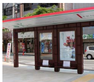
(左)チョコレート型のバス停 阪神御影南口(バレンタイン広場前) (右)イタリア中部地震へのモロゾフの支援を報じた地元の新聞記事