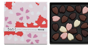
ひとひら(爛漫) 540円(税込) 20個入

香ばしいアーモンドクラン チ入りミルクと、プレーンエキ ストラミルクチョコレートの 詰合せ。