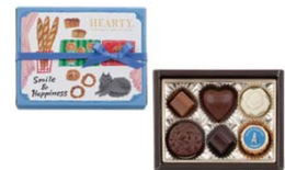
ハーティー(ブルー) 324円(税込) 28g/6個入