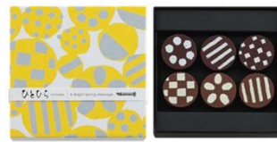
ひとひら(うらら嬉々) 756円(税込) 6個入

コーヒーガナッシュ入りミルク、 プレーンエキストラミルク、 プレーンホワイトチョコレートを アソート。