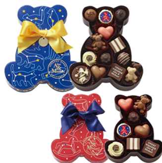
ラブリーベア (上)1,944円(税込) 15個入 (下)1,080円(税込) 9個入