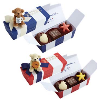
ラブリーベア (ブルー)/(レッド) 各648円(税込) 各5個入