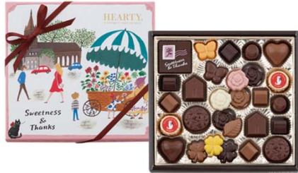
ハーティー(ピンク) 1,080円(税込) 28個入