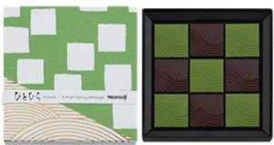
ひとひら(庭石) 756円(税込) 9個入

柚子ガナッシュ入りのミルクチョコ レートと桃ガナッシュ入りのス イートチョコレートの詰合せ。 ※チョコレートのプリントデザインは商品に より異なります。