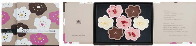
ひとひら 1,620円(税込) 7個入

最中を組み合わせた和菓子風のチョコレートの詰合せ。 柚子、ストロベリー、ミルク、3種類の味が楽しめます。