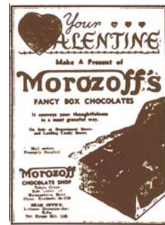
1936年2月12日 英字新聞に掲載した バレンタインデー広告

今から80年以上前、モロゾフの創業者が米国人の友人を通じて2月14日に贈り物をする欧米の習慣を知りました。そして、この素敵な文化を日本に広めようと尽力したのです。1936年には英字新聞「ジャパンアドバタイザー」に、日本初のバレンタイン広告を掲載しました。モロゾフは、愛とロマンに満ちたメッセージをチョコレートに託して発信しました。