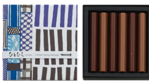
ひとひら(寄せ木模様) 756円(税込) 6個入

宇治抹茶ガナッシュ入りチョコ レートとプレーンのスイート チョコレートの詰合せ。