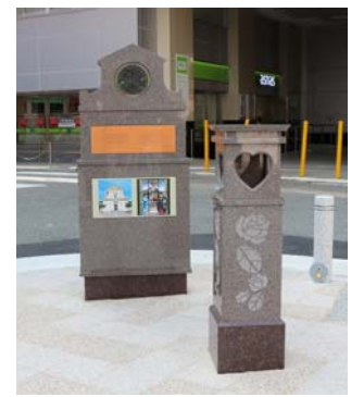
御影石製の聖バレンチノ教会 モニュメント(阪神御影駅前)