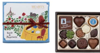
ハーティー(ブルー) 540円(税込) 49g/12個入