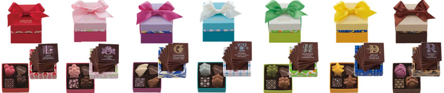
アミティエ 各800円(税込) 各13個入(2段詰)