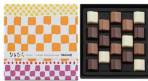
ひとひら(花鰯) 756円(税込) 18個入

コーヒーガナッシュ入りミルク、 プレーンエキストラミルク、 プレーンホワイトチョコレートを アソート。