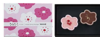
ひとひら(紅) 540円(税込) 2個入